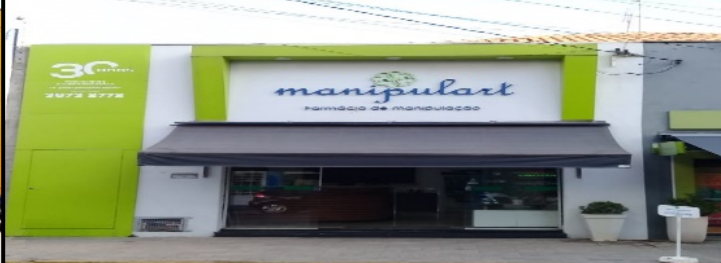
Farmácia de Manipulação Rua Dr. Alfredo Guedes, 141 WhatsApp 9 9110-5582