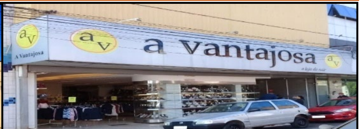
Loja de roupas e acessórios Rua Dr. Alfredo Guedes, 182 - Tambaú-SP Telefone: (19) 3673-2041