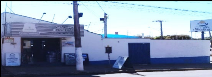
Xerife Tambaú Gás, Água e Bebidas Rua Anézia M. Modesto, 129-Tambaú-SP WhatsApp 9 9318-2541