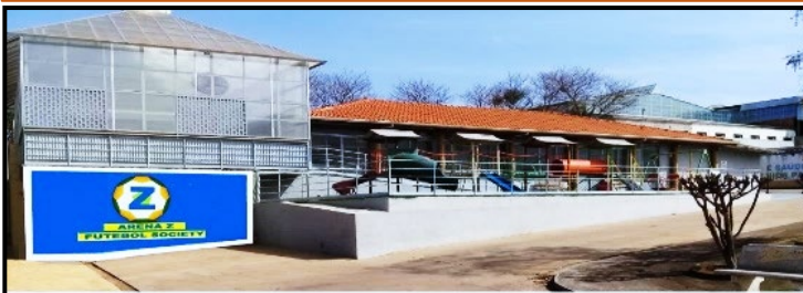
Arena Z Festas - Tambaú-SP Rodovia Padre Donizetti, S/Nº - km 272 WhatsApp 9 9388-1707 - 9 9408-5120

Tambaú-SP - Edição Nº 11 - Maio de 2026 - Distribuição gratuita - Pág. 2