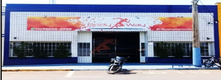
Body Way Fitness Academia Av. José Gatto, 1031-Centro-Tambaú WhatsApp (19) 9 9293-6286