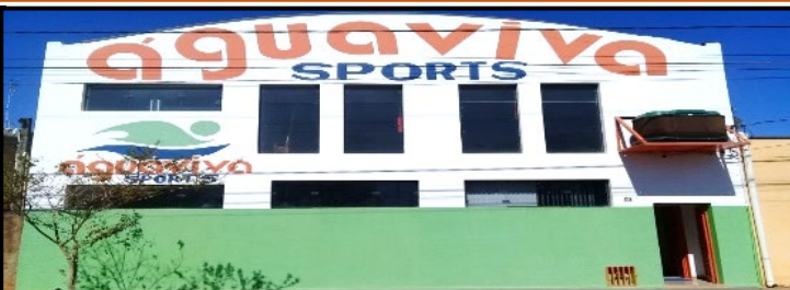
Água Viva Sports - Natação e Hidroginástica Rua Ceará, 115-Centro-Tambaú-SP WhatsApp 9 9210-6470