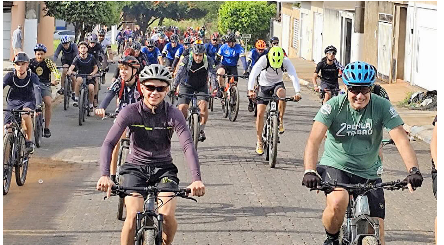
Ranking mostra cidades do Brasil com a melhor e a pior qualidade de vida em 2026; veja a lista