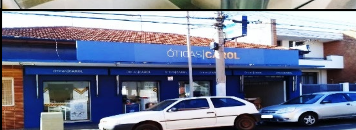
Óticas Carol Rua Dr. Alfredo Guedes, 288 - Tambaú-SP WhatsApp 9 9267-1318