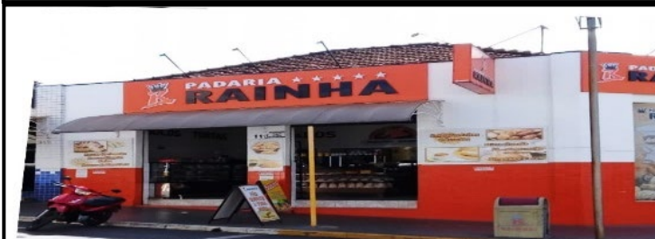
Padaria Rainha Rua Santo Antônio, 113-Tambaú-SP Fone: (19) 3673-1740