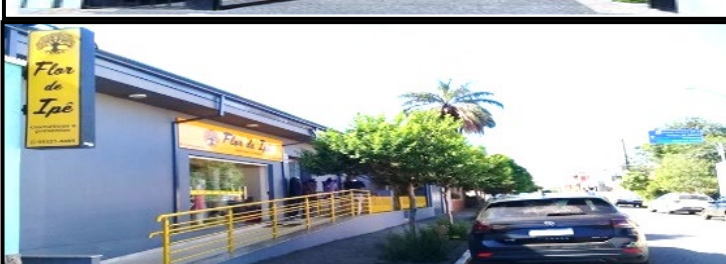
Flor de Ipê - Cosmético, loja e presentes Rua José Lepri, 41 - Centro-Tambaú-SP WhatsApp 9 9321-4485