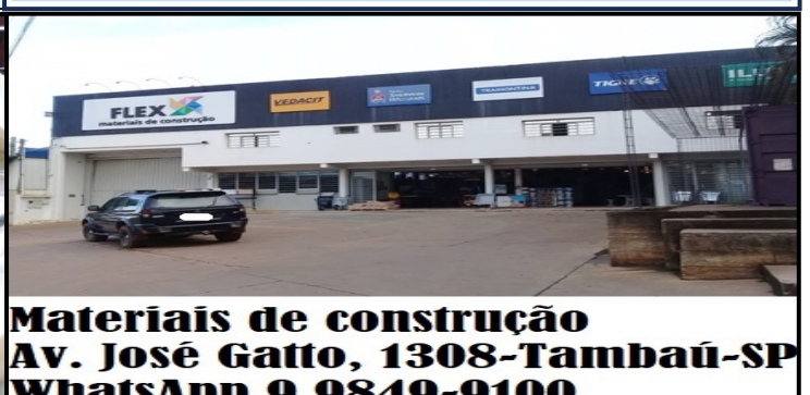
Materiais de construção Av. José Gatto, 1308-Tambaú-SP WhatsApp 9 9849-9100