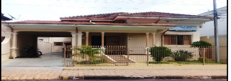
Escritório de Contabilidade Santo Antônio Rua João Godoy, 153 - Centro - Tambaú-SP Telefone: (19) 3673-1056