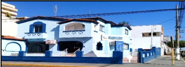
Dr. Sorriso-Clinica Odontológica-Tambaú-SP Rua Cel. José Vilella, 140 - Centro WhatsApp (19) 9 9225-0143 - (19) 3673-7289