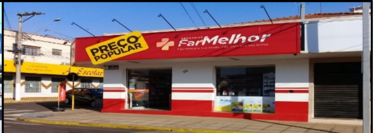
FarMelhor - Farmácia Rua Dr. Alfredo Guedes, 311 - Tambaú-SP WhatsApp 9 9716-0111