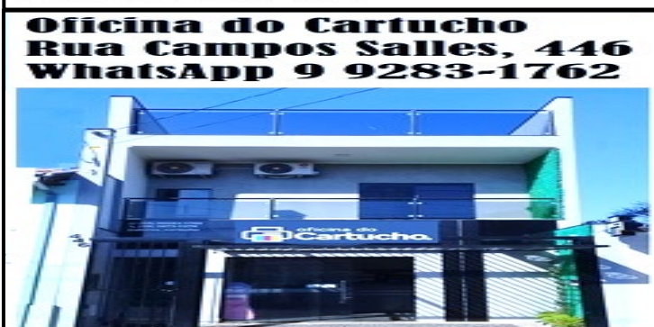
Oficina do Cartucho Rua Campos Salles, 446 WhatsApp 9 9283-1762