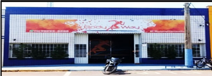
Body Way Fitness Academia Av. José Gatto, 1031-Centro-Tambaú WhatsApp (19) 9 9293-6286