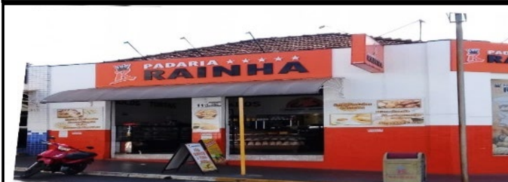
Padaria Rainha Rua Santo Antônio, 113-Tambaú-SP Fone: (19) 3673-1740