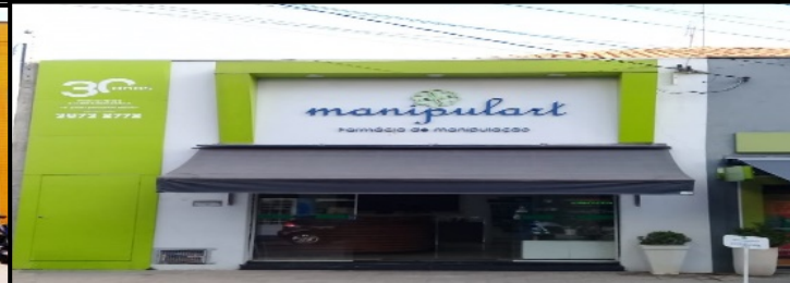
Farmácia de Manipulação Rua Dr. Alfredo Guedes, 141 WhatsApp 9 9110-5582