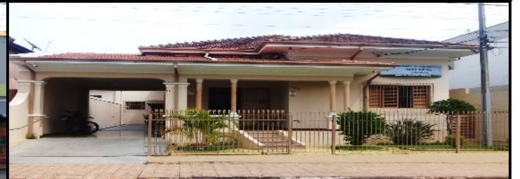
Escritório de Contabilidade Santo Antônio Rua João Godoy, 153 - Centro - Tambaú-SP Telefone: (19) 3673-1056