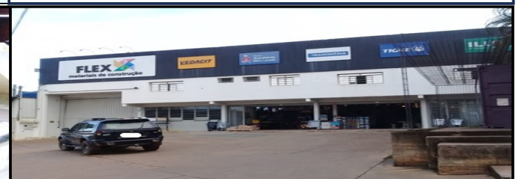
Materiais de construção Av. José Gatto, 1308-Tambaú-SP WhatsApp 9 9849-9100

dellamed Cadeira de Banho D30 Silla de baño D30 100% aluminio 3x1 360° 15 años