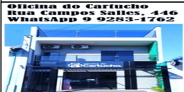
Oficina do Cartucho Rua Campos Salles, 446 WhatsApp 9 9283-1762