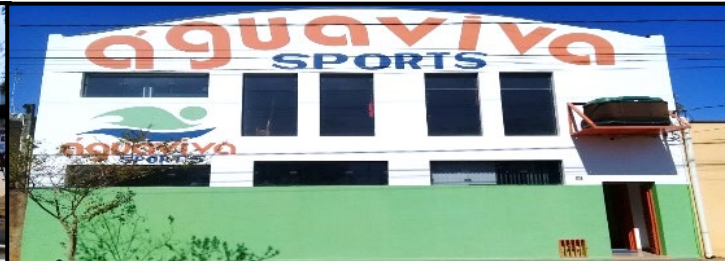
Água Viva Sports - Natação e Hidroginástica Rua Ceará, 115-Centro-Tambaú-SP WhatsApp 9 9210-6470