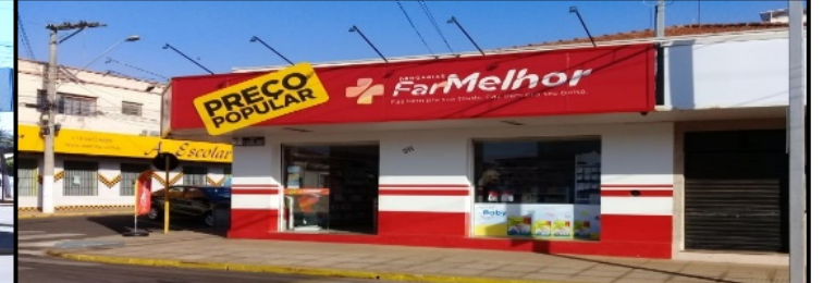
Farmelhor - Farmácia Rua Dr. Alfredo Guedes, 311 - Tambaú-SP WhatsApp 9 9716-0111