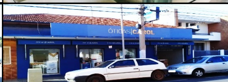
Óticas Carol Rua Dr. Alfredo Guedes, 288 - Tambaú-SP WhatsApp 9 9267-1318