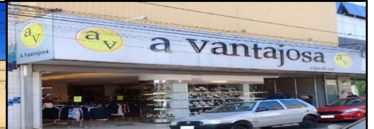
Loja de roupas e acessórios Rua Dr. Alfredo Guedes, 182 - Tambaú-SP Telefone: (19) 3673-2041