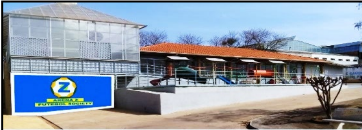
Arena Z Festas - Tambaú-SP Rodovia Padre Donizetti, S/Nº - km 272 WhatsApp 9 9388-1707 - 9 9408-5120

Tambaú-SP - Edição Nº 10 - Abril de 2026 - Distribuição gratuita - Pág. 2